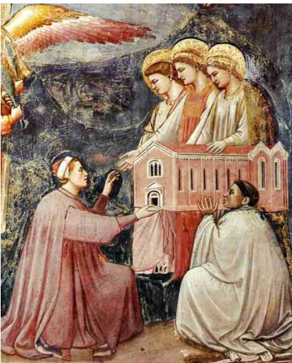
Enrico Scrovegni offre alla Madonna un modellino della Cappella