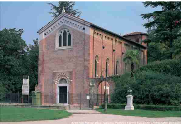
La Cappella degli Scrovegni

Gli Scrovegni possedevano case merlate o palazzi nelle contrade di S. Nicolò e S. Pietro a Padova, proprietà terriere tra Padova e Vicenza ed in numerosi villaggi limitrofi, tra cui Selvazzano. Fu Enrico Scrovegni, figlio di Rinaldo, che fece erigere la famosa cappella degli Scrovegni per riscattare l'anima del padre.