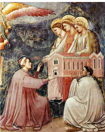
Enrico Scrovegni offre alla Madonna un modellino della Cappella