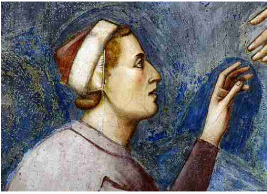
Enrico Scrovegni, particolare dagli affreschi di Giotto nella Cappella degli Scrovegni

Dalla fine del '200 fino a circa la metà del secolo successivo gli Scrovegni furono investiti ininterrottamente del feudo di Selvazzano.