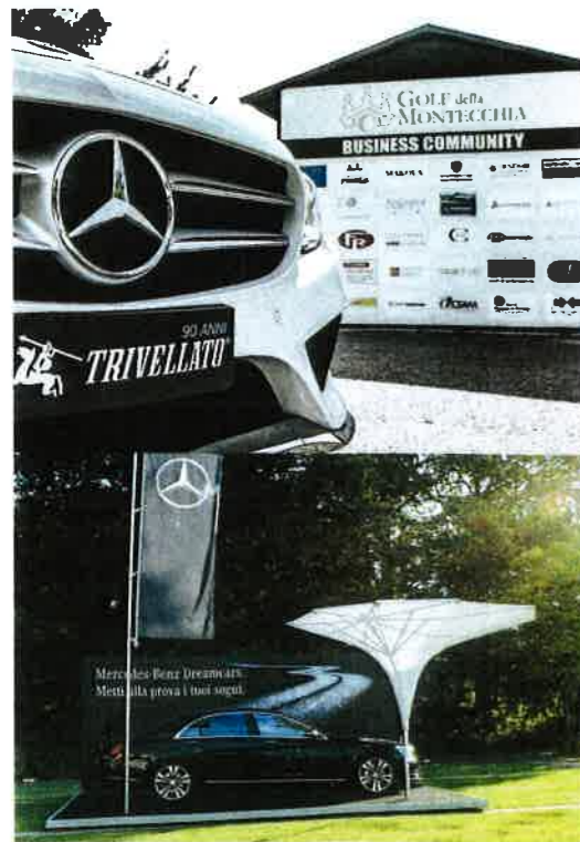
Golf Trophy Mercedes-Benz

Trivellato quest'anno presenta, dal 4 Maggio al 31 agosto, un prestigioso golf Trophy con quattro appuntamenti nei principali Golf del Veneto. Il primo si è svolto a maggio ai piedi dei Colli Euganei, nella magnifica location del Golf Club Frassanelle, poi il primo giugno presso l'elegante Golf Club Montecchia, il 15 Giugno tappa nel vicentino, nel golf club Colli Berici, per concludersi a fine agosto, il 31, al Golf Club Asiago. I vincitori si aggiudicano premi originali Mercedes-Benz e per tutti i clienti Trivellato Mercedes-Benz che ne hanno fatto richiesta l'iscrizione è gratuita.