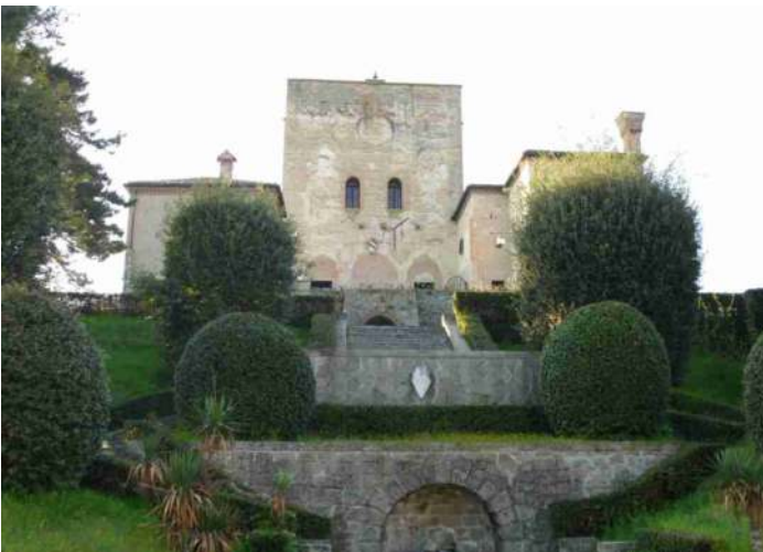
La torre centrale del Castello del Mottolo

E' a partire dal 1472, anno in cui Annibale Capodilista fu investito del feudo di Montecchia, che il luogo lega la sua fama al nome dell'antica e illustre casata che ne è, ancora oggi, proprietaria. Il sistema fortificato, anche a causa delle diverse proprietà, ha subito numerose modifiche nel corso dei secoli e la torre è l'unica superstite di varie fortificazioni. All'inizio del '900 il conte Lionello Emo-Capodilista intraprese una complessiva opera di rinnovamento: restaurò, con la suggestione del linguaggio decorativo dell'epoca, l'ala con le alte finestre ad arco che era stata costruita nel '500 a ridosso della torre, sul lato occidentale; costruì inoltre un nuovo complesso di edifici di atmosfera medioevale, frutto dell'ispirazione a diversi modelli di castelli e adattò il tutto a luogo di villeggiatura. La caratteristica di questo castello, comunque, è data dal suo rapporto con il terreno circostante che rende palese quanto già evidenziato nei documenti: la vocazione rurale della postazione, ricca di vigneti e di prati per il pascolo.