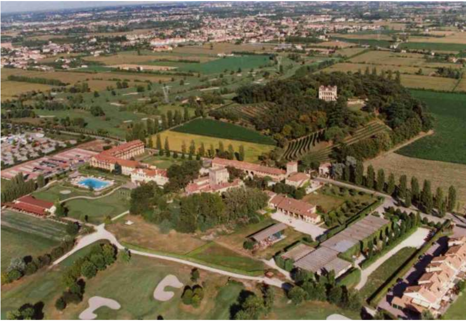
Il Castello del Mottolo e di fronte la Villa Emo Capodilista