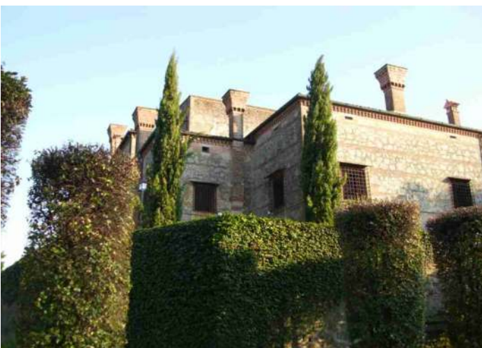
Torre centrale vista dal retro