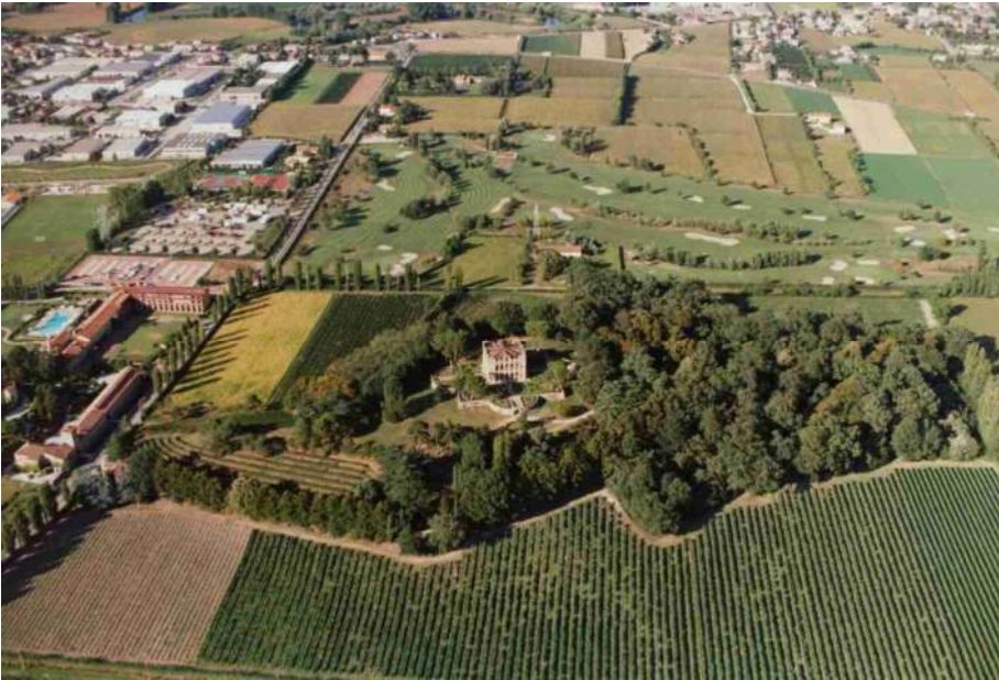
Altre vedute esterne della Villa Emo Capodilista